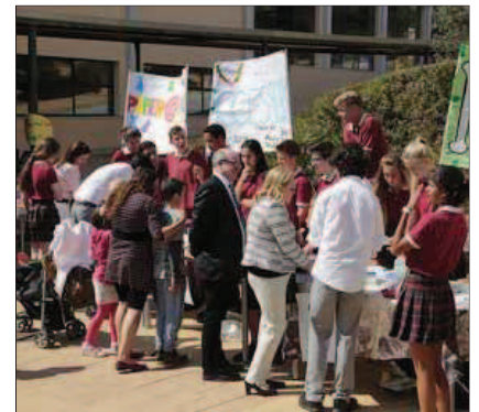
No faltaron los mercadillos solidarios.