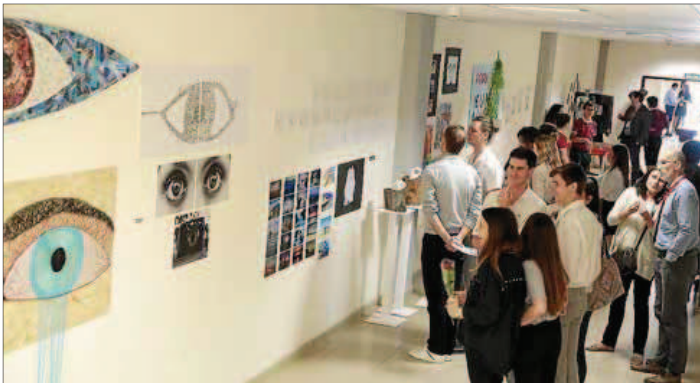
Los asistentes se mostraron muy interesados en los trabajos realizados por los alumnos.