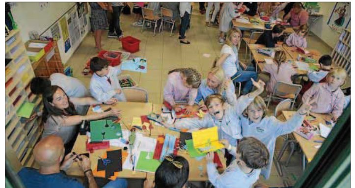
Los más pequeños se lo pasaron estupendamente con los juegos en clase.