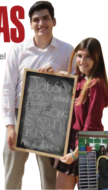
► EXPOSICIÓN Los alumnos del ciclo de ESO realizaron una muestra llamada 'De la tablilla a la tablet'