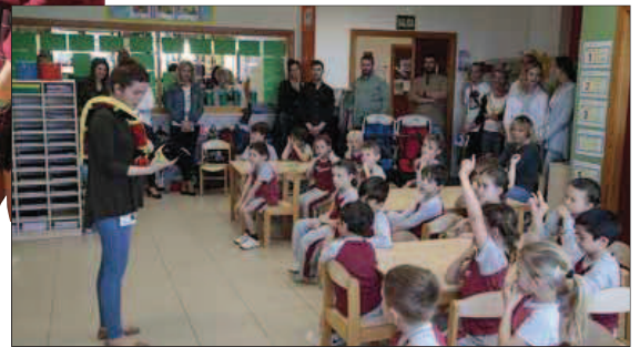
Los interesados pudieron ver cómo se desarrolla una clase.